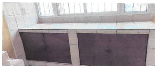
Foto 3: Colocación de azulejo e instalación de ventanas en mueble de la cocina.