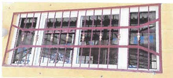
Foto 5: Fabricación e instalación de balcones y ventanas en aula 1 y 2.