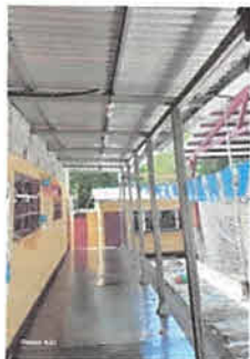
Foto 1: Sustitución del techo de las aulas 1, 2 y corredor de la escuela.